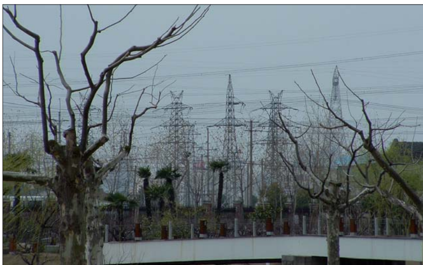
Bild 6. Umspannwerk bei Shanghai

wird eine weitere erhebliche Zunahme des Energieverbrauchs pro Kopf der Bevölkerung verbunden sein. Die mit der zunehmenden Verstädterung zu lösenden Fragen betreffen nicht zuletzt den Wohnungsbau und die Wasserversorgung: Etwa die Hälfte aller Wohnungen, die bis zum Jahr 2030 weltweit entstehen, werden in China gebaut werden; die Gebäudetechnik in China gilt allerdings als nicht sehr energieeffizient. Bei der Wasserversorgung sollen 440 von 660 Städten dauerhaft über zu wenig Wasser verfügen; in 110 Städten komme es immer wieder zu gravierenden Versorgungsengpässen [7].